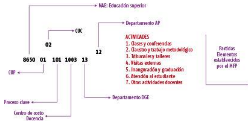
Figura 2. Niveles de registro.

En cuanto a la etapa vinculada al registro de los gastos, la principal novedad responde a la inclusión de las actividades y los procesos como niveles de registro (Figura 2), atendiendo a los resultados alcanzados en la primera fase. Los gastos se registran según el Clasificador de objetos de gastos aprobado en Cuba para las unidades presupuestadas (UP), el Nomenclador de actividades económicas (NAE) y por centros de costos. Existe, además, una clasificación para la moneda nacional, el peso convertible y las partidas de gastos y otros elementos establecidos por el Ministerio de Finanzas y Precios (MFP), adecuados a las particularidades de la educación superior. Todo ello se expone en el Modelo de gestión económico-financiera del Ministerio de Educación Superior (MES, 2017).