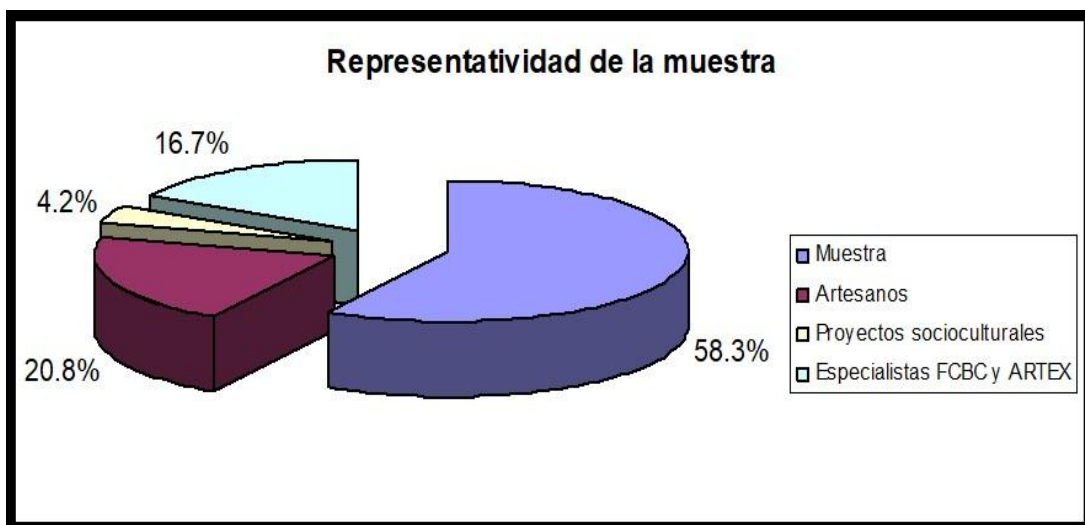
Figura 1. Representatividad de la muestra.

El universo de la investigación estuvo integrado por 82 sujetos vinculados a la producción, comercialización y preservación de las artesanías tradicionales. A partir de un muestreo probabilístico de tipo aleatorio, se seleccionó una muestra de 48 sujetos para un 58,3% de representatividad.