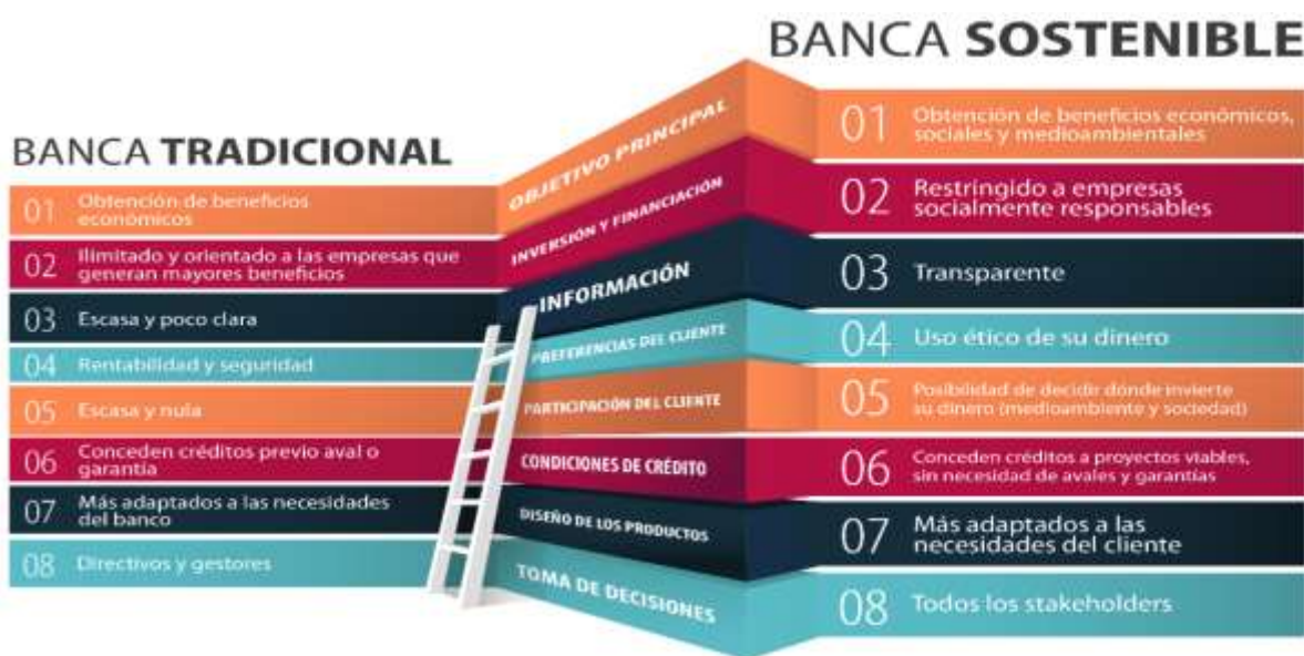
Figura 2. Comparación entre la banca sostenible y la banca tradicional.

Por último, la banca sostenible es aquella que ofrece productos y servicios llamados sostenibles, por conciencia y decisión propia de sus accionistas, directivos y empleados, y además los provee solamente a aquellos clientes que toman en consideración el impacto de sus actividades en el medioambiente y en la sociedad misma (Aracil, 2015). Por tanto, se puede decir que es un término con mayor alcance que los anteriores, pues considera con igual relevancia los factores económicos, ambientales y sociales. Asimismo, asume el desafío de desarrollar políticas con criterios sustentados sobre la base de estos tres pilares. Por ello, con respecto a la banca tradicional, manifiesta importantes ventajas que se muestran en la Figura 2.