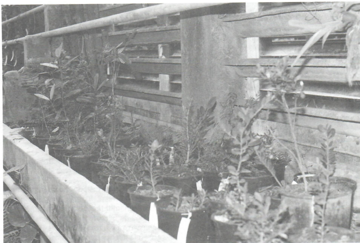
Fig. 2. Vista general de la colección de Buxus en el vivero del Jardín Botánico Nacional.

adaptativo y como colección (Fig. 2) en los diferentes umbráculos de cultivo en el vivero de esta institución.