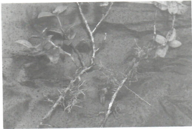
Fig. 3. Ramas con raíces de Buxus rheedioides .

Merece destacarse, que por primera vez se observó en B. rheedioides la capacidad que tienen las ramas que entran en contacto con el suelo para diferenciar raíces adventicias; por lo que se utilizó esta potencialidad para tomar fragmentos enraizados y plantarlos en macetas (Fig. 3).