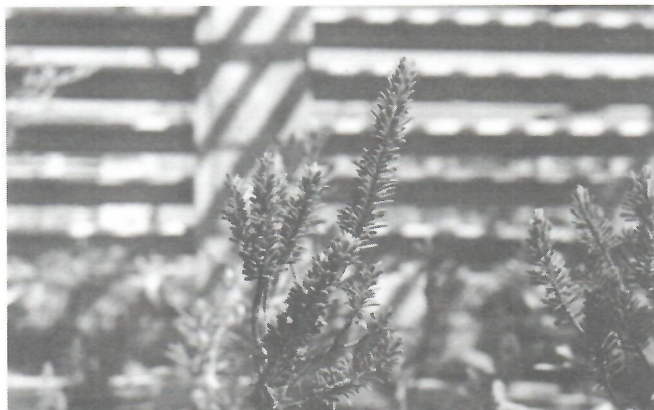
Fig. 9. Buxus revoluta , en el vivero del Jardín Botánico Nacional.

Se ha localizado en reiteradas ocasiones una subpoblación de B. imbricata en la cima del Pico Cristal (1 200 m snm); por otra parte en 1987 se encontró una subpoblación en Rosa Castillo (Holguín - Mayarí), localidad visitada nuevamente en 1995 y 1997, no encontrándose ningún ejemplar ya que esta zona ha tenido gran