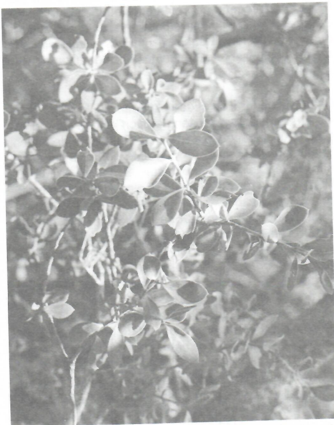
Fig. 6. Buxus jaucoensis , Paredones del río Jauco (Guantánamo).

Se relocalizó además B. jaucoensis (Fig. 6), conocida exclusivamente del tipo, colectada en 1959 por Alain y López Figueiras (Alain & López Figueiras 7084, Isótipo HAJB) (Tabla III). Esta especie vive en las grietas de los