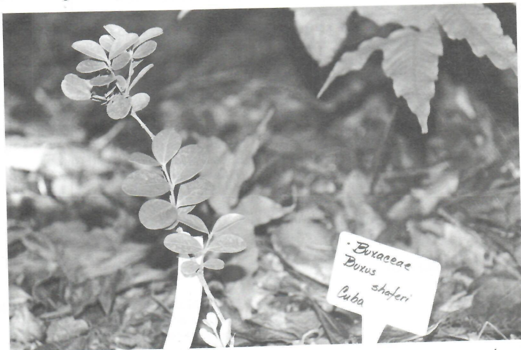
Fig. 1. Ejemplar de Buxus shaferi en el Pabellón de Exposición 3 del Jardín Botánico Nacional.

Hasta el presente se han concluido cuatro fases de dicho proyecto, llevadas a cabo durante los años 1995-1998. Los trabajos incluyeron visitas a localidades naturales en áreas de Cuba oriental (Holguín, Santiago de Cuba y Guantánamo), incorporación de algunas de las especies a los Pabellones de Exposición del Jardín Botánico Nacional y las restantes mantenidas en el proceso