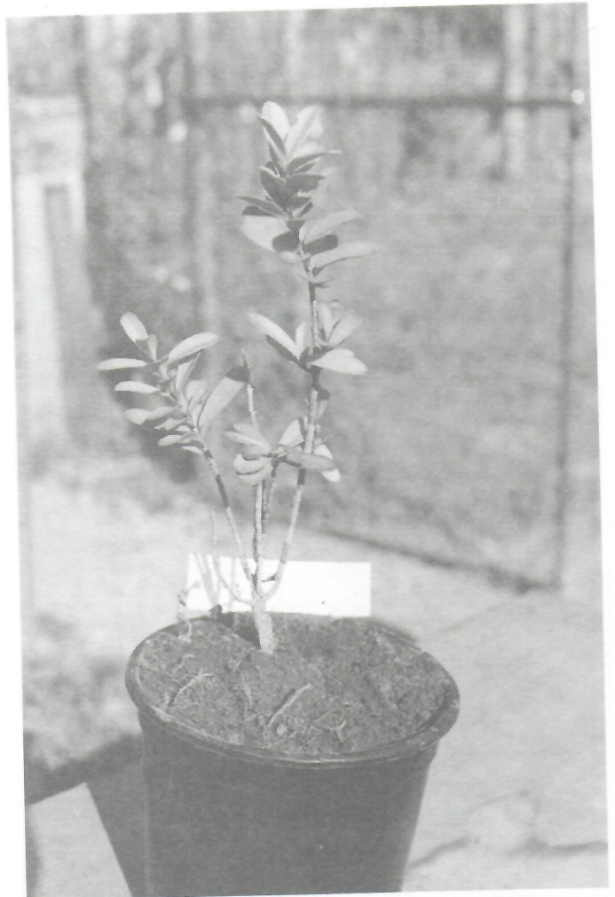
Fig. 7. Buxus acunae , en el vivero del Jardín Botánico Nacional.

paredones rocosos que flanquean al río Jauco, en donde se acumula alguna materia orgánica.