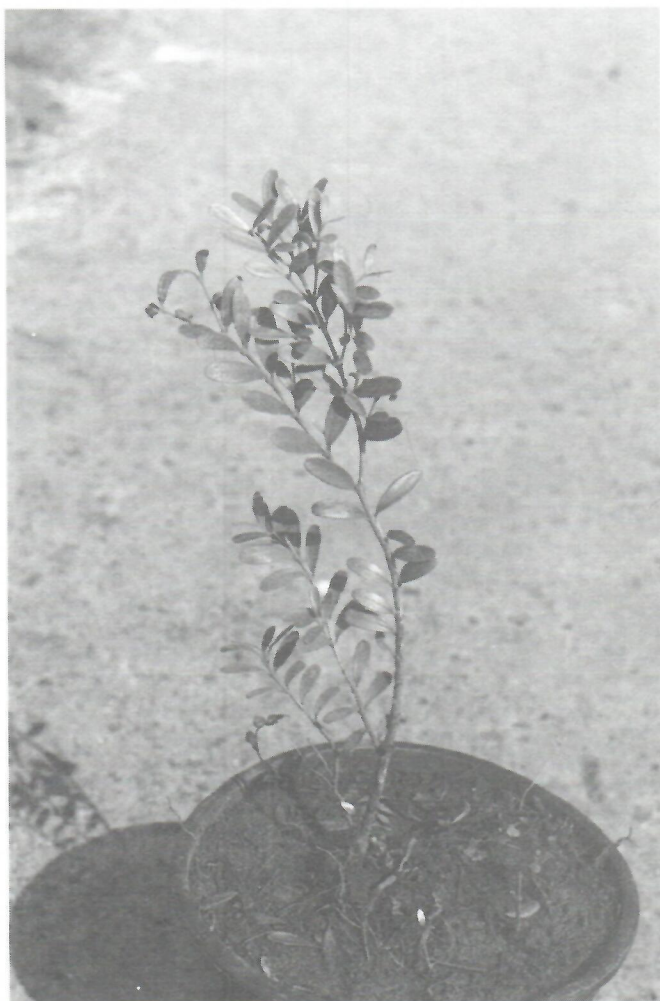
Fig. 8. Buxus moana , en el vivero del Jardín Botánico Nacional.

lo abierto, sobre todo si se tiene en cuenta que las poblaciones de Buxus son puntuales, y sumamente pequeñas en cuanto al número de plantas presentes en ellas. Ello hace aún más urgente que se estudien las vías de propagación de estas especies con vistas a evitar su desaparición mediante su introducción en otros ecótopos similares que no estén amenazados por la explotación minera (Tabla IV).