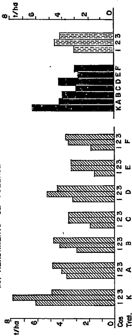
Fig. 1c-Rendimiento de plantas de Datura candida (Pers.) Safford procedentes de diferentes formas de pro- pagación vegetativa.