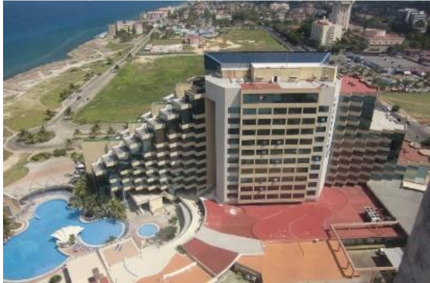
Figura 10. Hotel Panorama.