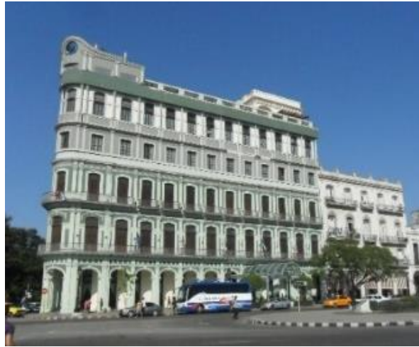
Figura 14. Rehabilitación Hotel Saratoga.

generales, al cual se le adicionaron dos nuevas plantas sin grandes afectaciones al tradicional perfil de esa importante fachada del Prado habanero (Figura 14).