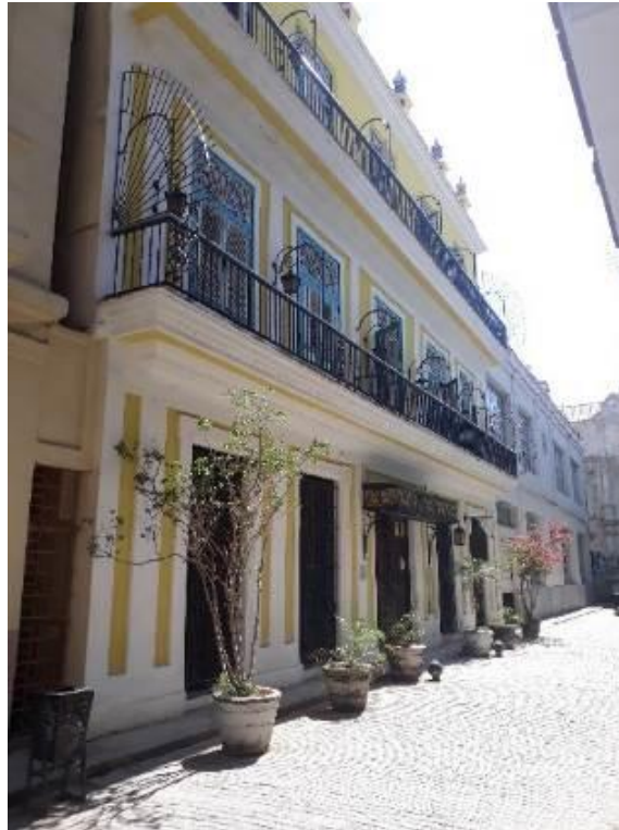
Figura 12. Hostal Los Frailes.

Hostal Los Frailes, mostrado en la Figura 12, el hotel Habana 612 y el hotel Comendador.