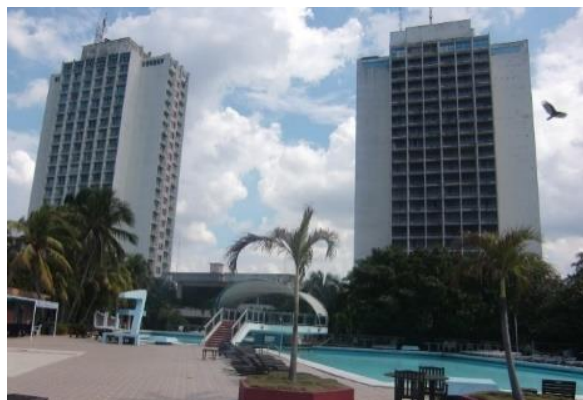
Figura 9. Complejo Hoteles Neptuno-Tritón.

El principal proyecto hotelero de nueva planta construido en los años setenta en la ciudad capital fue el Hotel Tritón, proyecto del arquitecto Vicente Lanz, ubicado en los terrenos de Monte Barreto en Miramar, zona urbana que había quedado sin construir al triunfo de la Revolución. Es un edificio de 20 plantas con tipología de torre y basamento, ejecutado con el sistema constructivo de «moldes deslizantes», también utilizado en edificios altos de vivienda, que solo se repitió en su «torre gemela», el Hotel Neptuno, completada posteriormente. Este complejo Neptuno-Tritón fue el primero de la actual zona hotelera y de negocios al oeste de la capital, desarrollada, fundamentalmente, a partir de los años noventa (Figura 9).