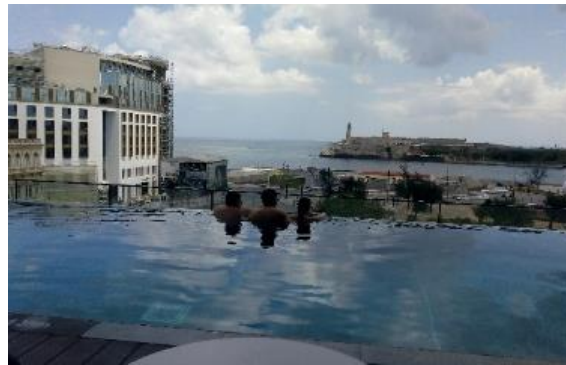
Figura 16. Hotel Packard.