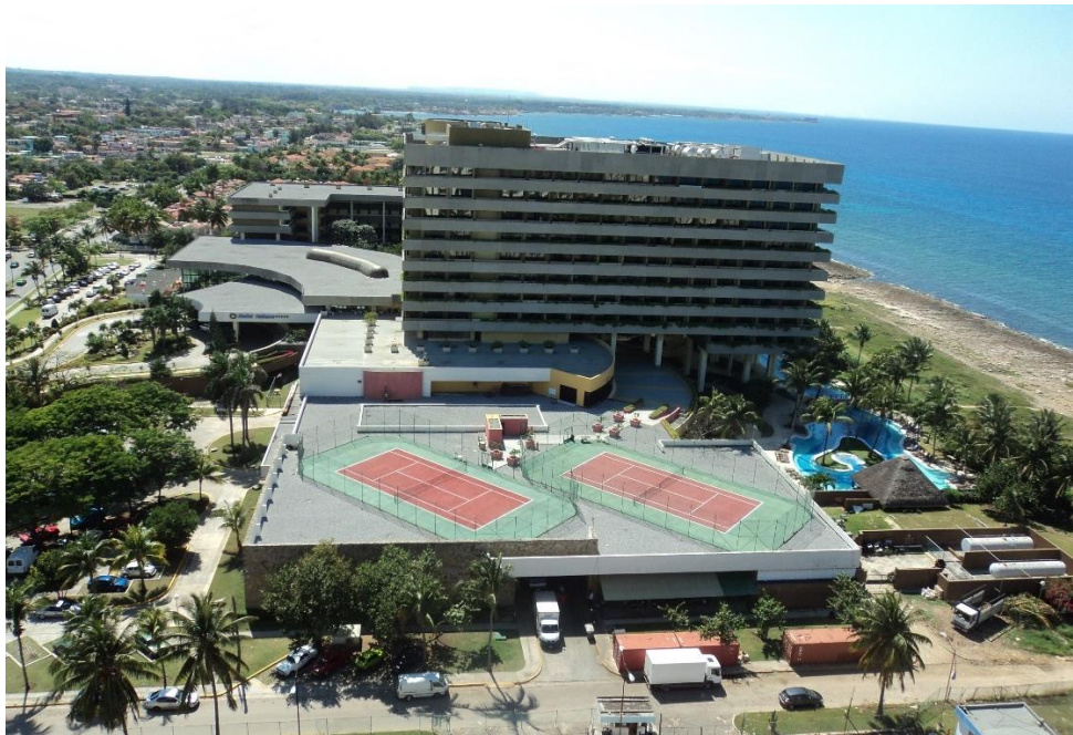
Figura 11. Hotel Meliá Habana.

En 1993 el centro fundacional de la ciudad fue declarado «Zona priorizada para la conservación». En 1994 se creó la compañía Habaguanex, encargada de la gestión económica, y a partir de 1995 se consideró «Zona de alta significación para el turismo» (Oficina del Historiador de La Ciudad de la Habana, 2011), gracias a lo cual fue posible la gestión autofinanciada del territorio. Se refuncionalizaron antiguos hoteles, mansiones y palacios fueron transformados en pequeños hostales y se construyeron nuevas instalaciones de alojamiento con pocas capacidades y servicios reducidos para el turismo cultural. Entre ellos pueden destacarse el