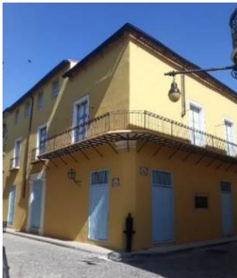
Figura 1. Casa de la Obrapía.

A partir de la clasificación tipológica propuesta por Menéndez García (2007) para la arquitectura colonial doméstica, las nueve edificaciones identificadas son del tipo «complejo»: ocho con dos o más plantas, cinco con entresuelo y solo una uniplanta. La mayoría se encuentran en lotes de esquina y todas poseen patios laterales o centrales. Privilegiada ubicación y particular diseño presentan las localizadas en Obrapía n.º 158, como se muestra en la Figura 1, Muralla n.º 101 y San Ignacio n.º 360. Algunos casos mantienen aún la función hotelera, aunque con modificaciones tecnológicas y espaciales, como el Hotel Florida (1856) y el Santa Isabel (1867) (Martín y Rodríguez, 1998), ambos destacados a mediados del siglo XIX por el lujo y confort.