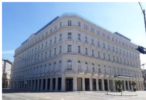
Figura 17. Hotel Manzana.

Con independencia de los compromisos que se derivan de la colaboración internacional en la industria turística, el futuro de la arquitectura hotelera en Cuba, y particularmente en La Habana, demanda concursos y licitaciones que permitan a los arquitectos cubanos demostrar sus capacidades.