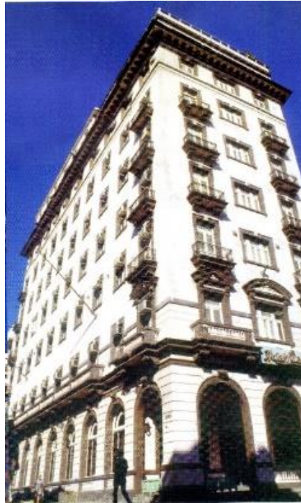
Figura 5. Hotel Lincoln.

Se promovió el interés por la zona oeste de La Habana, alejada de la ciudad antigua, con hoteles como el Presidente y el Hotel Palace, que asumieron códigos eclécticos y rasgos de los primeros rascacielos de la escuela de Chicago, al acentuar la verticalidad y separar en tres zonas el volumen de la edificación. En esta época todavía el basamento no se destaca como cuando el Movimiento Moderno asumió el modelo de la Lever House (1952) para edificios de oficinas y otros programas arquitectónicos, como el hotelero.