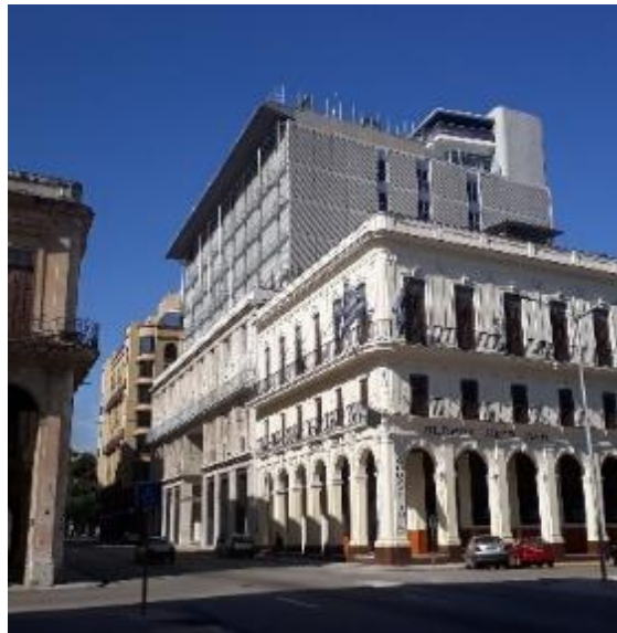
Figura 13. Ampliación del Hotel Parque Central.

La ampliación del hotel Parque Central, proyectado por el equipo del arquitecto José Antonio Choy es un ejemplo de ese periodo, que se integra al contexto con una imagen contemporánea (Figura 13) y constituye un referente atractivo para ciertos grupos de viajeros, al ser diseñado por el arquitecto nacional de mayor relevancia (Zamudio Vega, 2013).