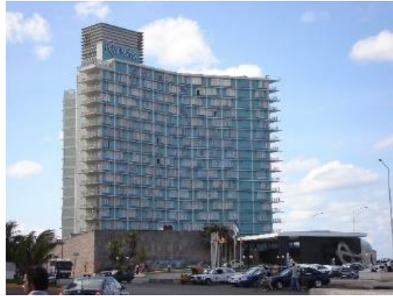
Figura 6. Hotel Habana Riviera.

(mostrados en las Figuras 6, 7 y 8, respectivamente) también asumieron otras características del Movimiento Moderno, como la planta libre y la flexibilidad de los espacios públicos interiores que asimilan múltiples usos, donde, además, la vinculación de la arquitectura con las artes plásticas en murales y esculturas de reconocidos artistas nacionales dejó una importante huella.