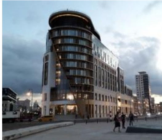
Figura 15. Hotel Paseo del Prado.