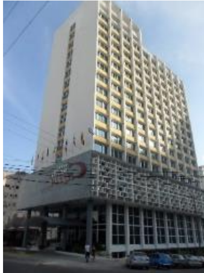
Figura 8. Hotel Capri.

También se construyeron hoteles más pequeños destinados a otros tipos de mercado, como el Colina (1954), el Vedado y el Saint John's (1956, segunda modificación), todos cercanos a la Universidad de La Habana, el Aerohotel, vecino al aeropuerto internacional y el Hotel Bruzón, próximo a la Terminal de Ómnibus. Según el directorio habanero, para el año 1959 el 52 % de las habitaciones hoteleras de Cuba se encontraban en La Habana (Lloga Fernández y Sánchez Martínez, 2013).