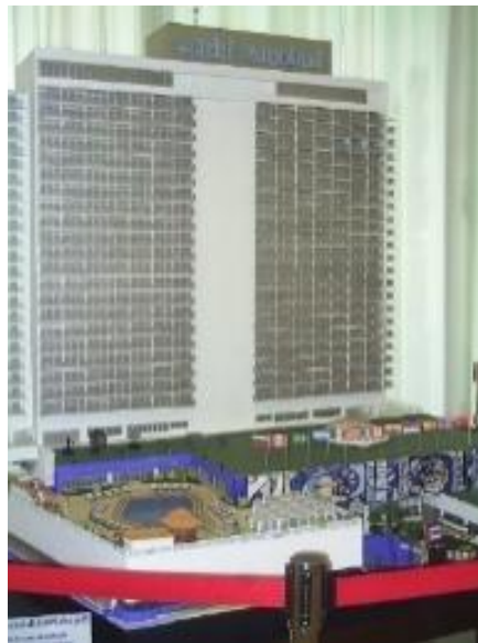
Figura 7. Antiguo hotel Habana Hilton.