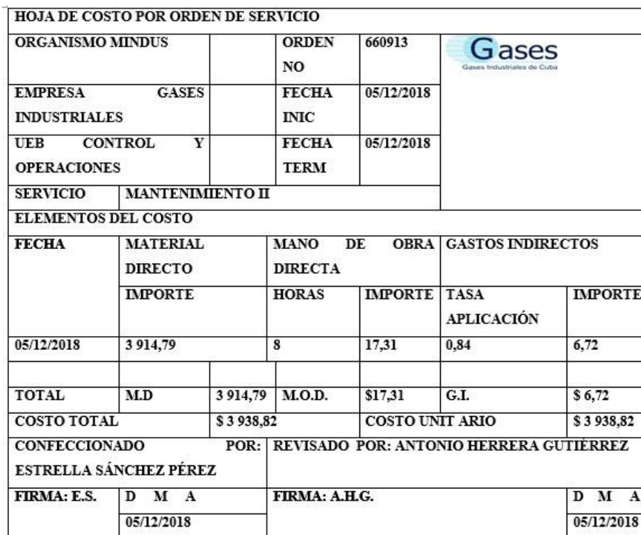
Tabla 6. Hoja de costo por orden de servicio

El registro de los gastos indirectos de producción reales en el período correspondiente a noviembre de 2018 es el que aparece en la Tabla 7.