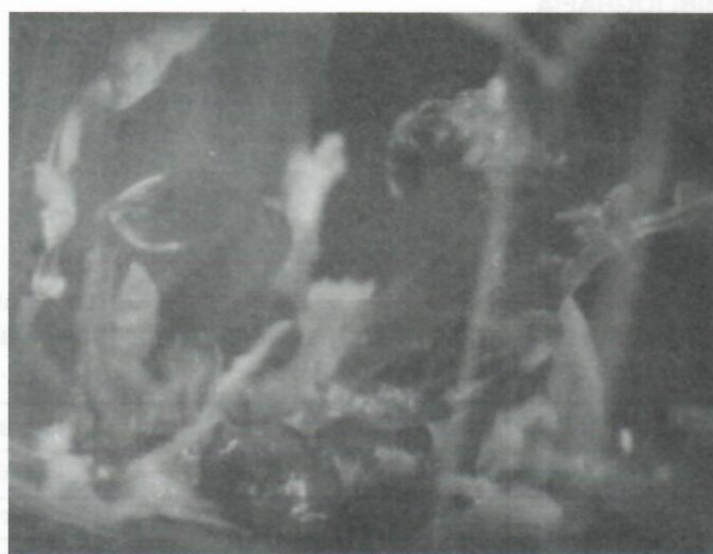
Fig. 2. Brotes de Leucaena leucocephala formados en medios con BA y combinaciones de BA y 2,4D. a) Mayores índices de brotación por ápices (3-4) con la adición de 4,0 mg/L de BA. b) Brotes múltiples (más de seis brotes por ápice), mejor definición de las estructuras formadas y mayor capacidad para continuar su crecimiento.