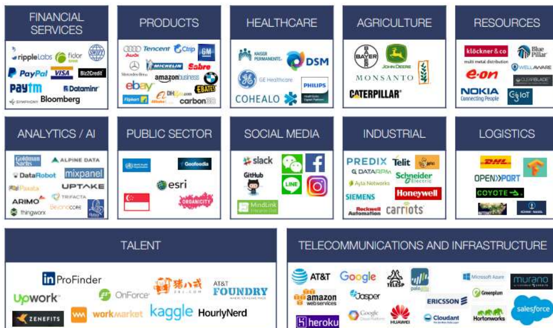
Gráfica 2: Selección de empresas B2B por sector