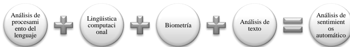
Figura 1. Análisis de sentimiento.

En realidad, los conjuntos neutrosóficos se utilizan para el análisis de sentimientos de las entrevistas como herramienta de investigación cualitativa (Kandasamy et al., 2020). Este estudio es el primer paso de una investigación que señala las indeterminaciones en el análisis discursivo (Smarandache et al., 2018).