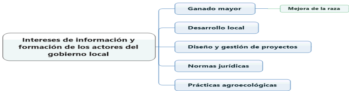
Figura III: Intereses de información y formación de los actores del gobierno local.