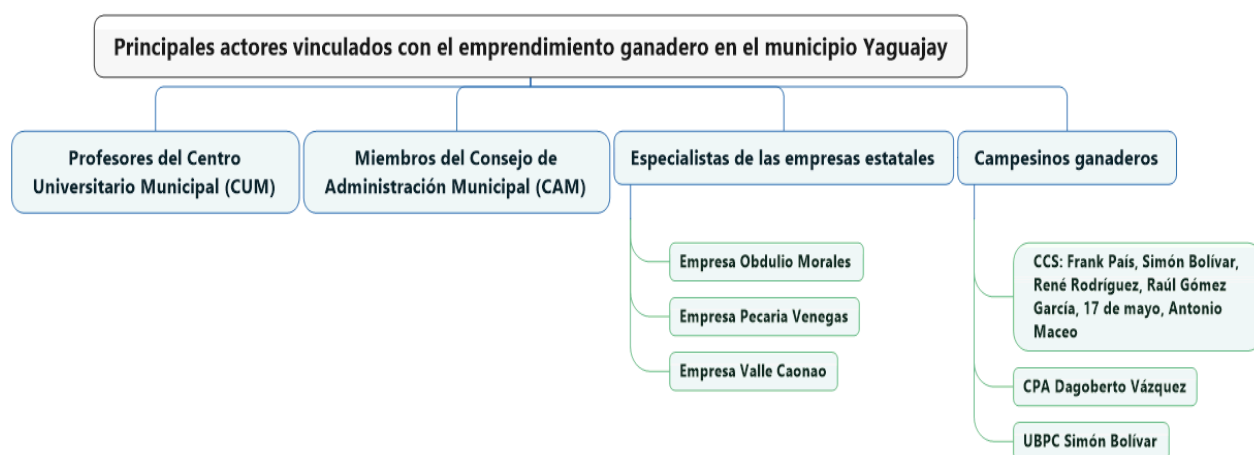
Figura II: Actores vinculados al emprendimiento en el sector no estatal ganadero.

La Figura II muestra los actores vinculados con el emprendimiento ganadero que conforman la muestra utilizada en la presente investigación.