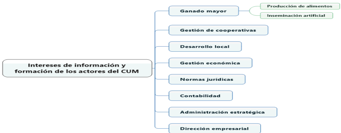
Figura IV: Intereses de información y formación de los actores del Centro Universitario Municipal.