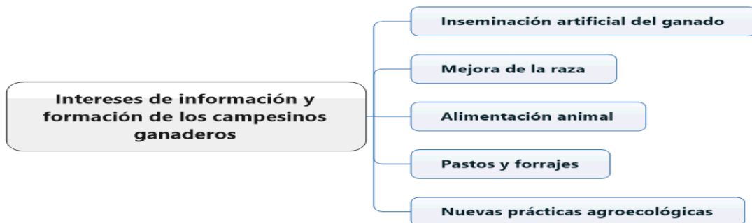
Figura V: Intereses de información y formación de los campesinos ganaderos.