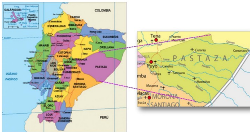
Figura 1. Ubicación geográfica de la provincia Pastaza en Ecuador