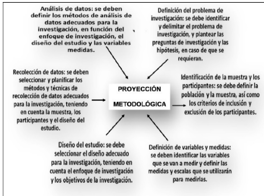
Figura 2. Elementos de la proyección metodológica en la investigación sobre el turismo rural en la provincia de Pastaza.

El diseño del estudio de caso: turismo rural en la provincia Pastaza, se orientó por un modelo de turismo integrado en el espacio analizado (Aranda, 2021). Partiendo de este estudio se han considerado los siguientes criterios: