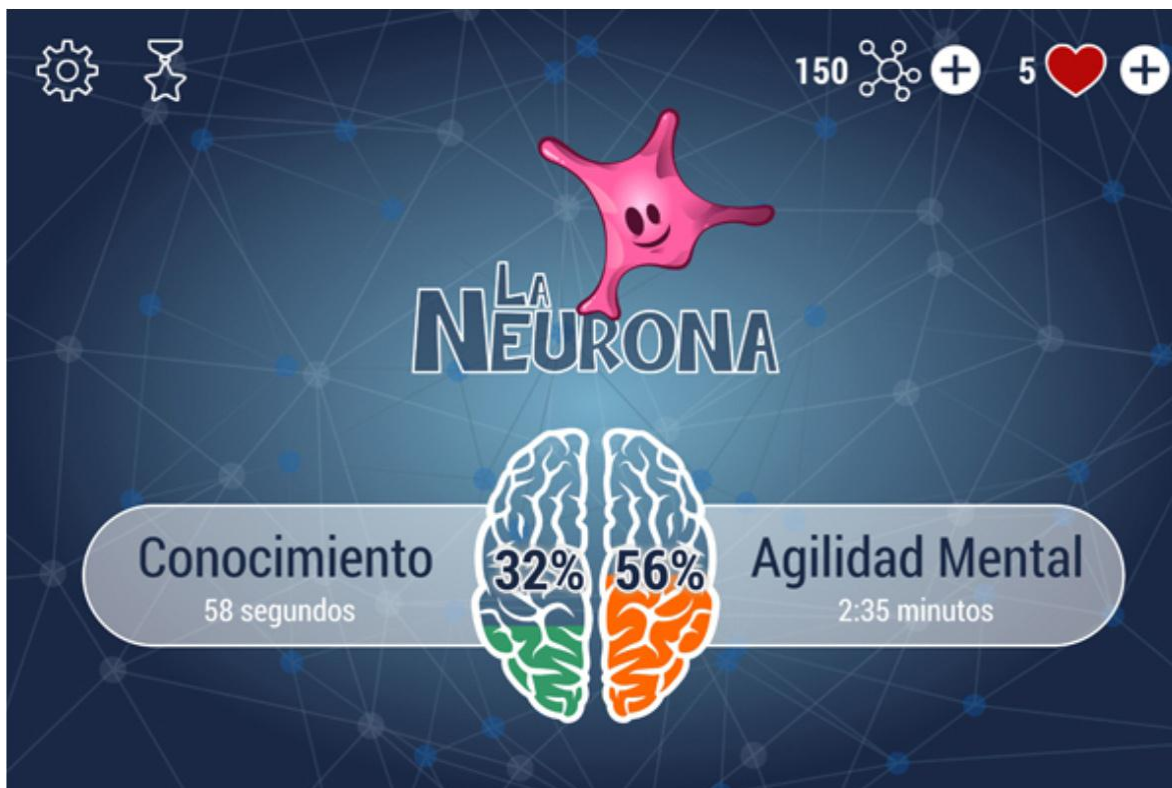
Figura 3. Pantalla principal del juego cubano La Neurona.