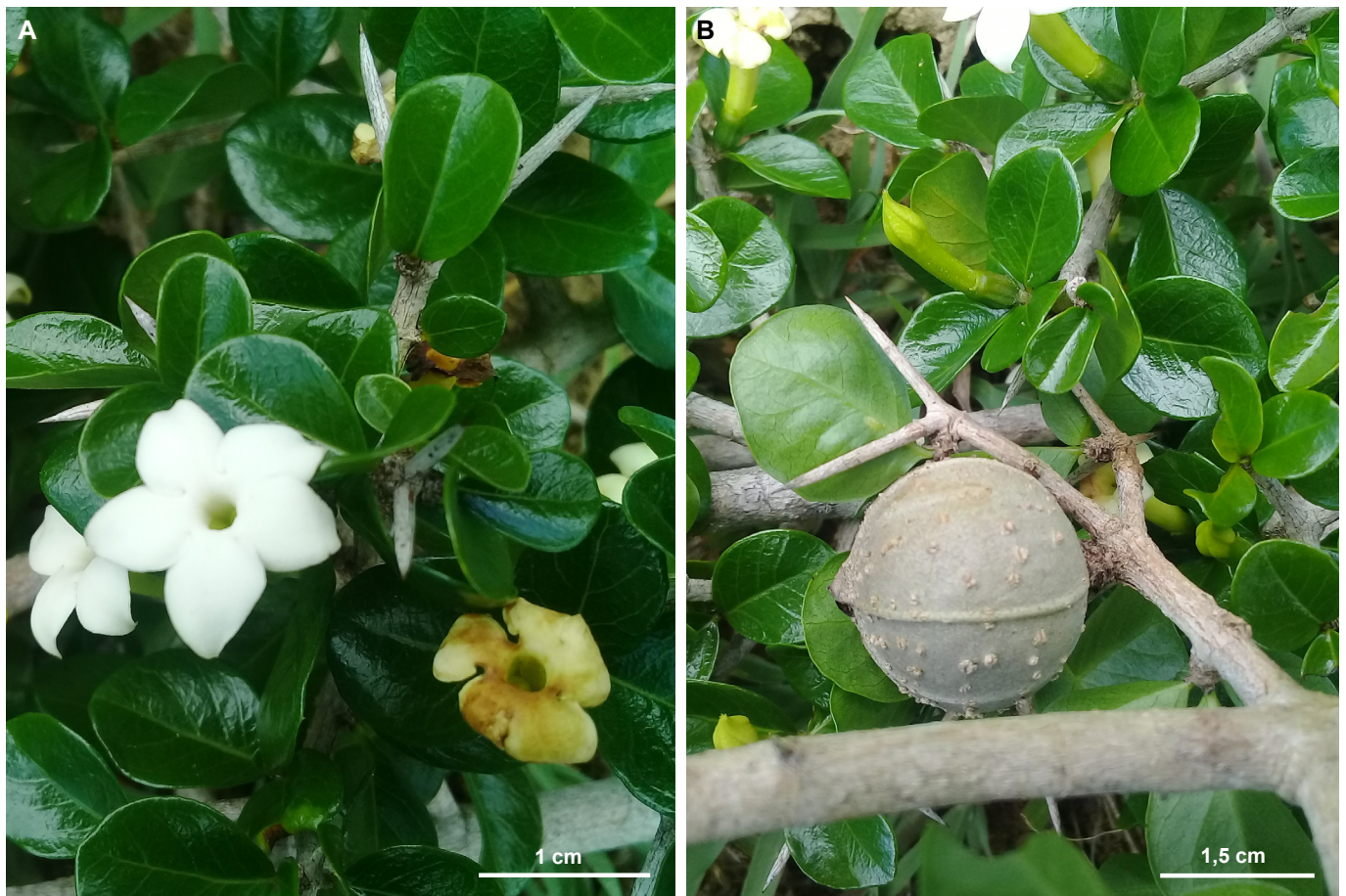
Fig. 2. Randia costata con flores (A) y con fruto (B), especie que se reporta por primera vez para la provincia Holguín. Fig. 2. Randia costata with flowers (A) and with fruit (B), a species reported for the first time for the Holguín province.

Zamia integrifolia se recolectó por primera vez en el municipio Antilla y en la provincia Holguín. La especie crece en Estados Unidos (Georgia y La Florida), Islas Cayman, Bahamas y Cuba. En Cuba se ha recolectado en varias provincias entre Pinar del Río y Las Tunas. Se conoce que Z. integrifolia crece en otras localidades de Holguín como Cayo Bariay, de donde González & al. (2001) la citaron como Zamia sp.; por esta razón se notifica como nuevo registro para el municipio y no para la provincia. La población de esta especie encontrada en Antilla es, hasta la actualidad, su localidad más oriental en Cuba, ya que en el último tratamiento de Zamiaceae para Cuba la localidad más oriental de esta especie es “Loma de Tabaco”, en el municipio Manatí de la provincia Las Tunas (González 2003, Greuter & Rankin 2022a).