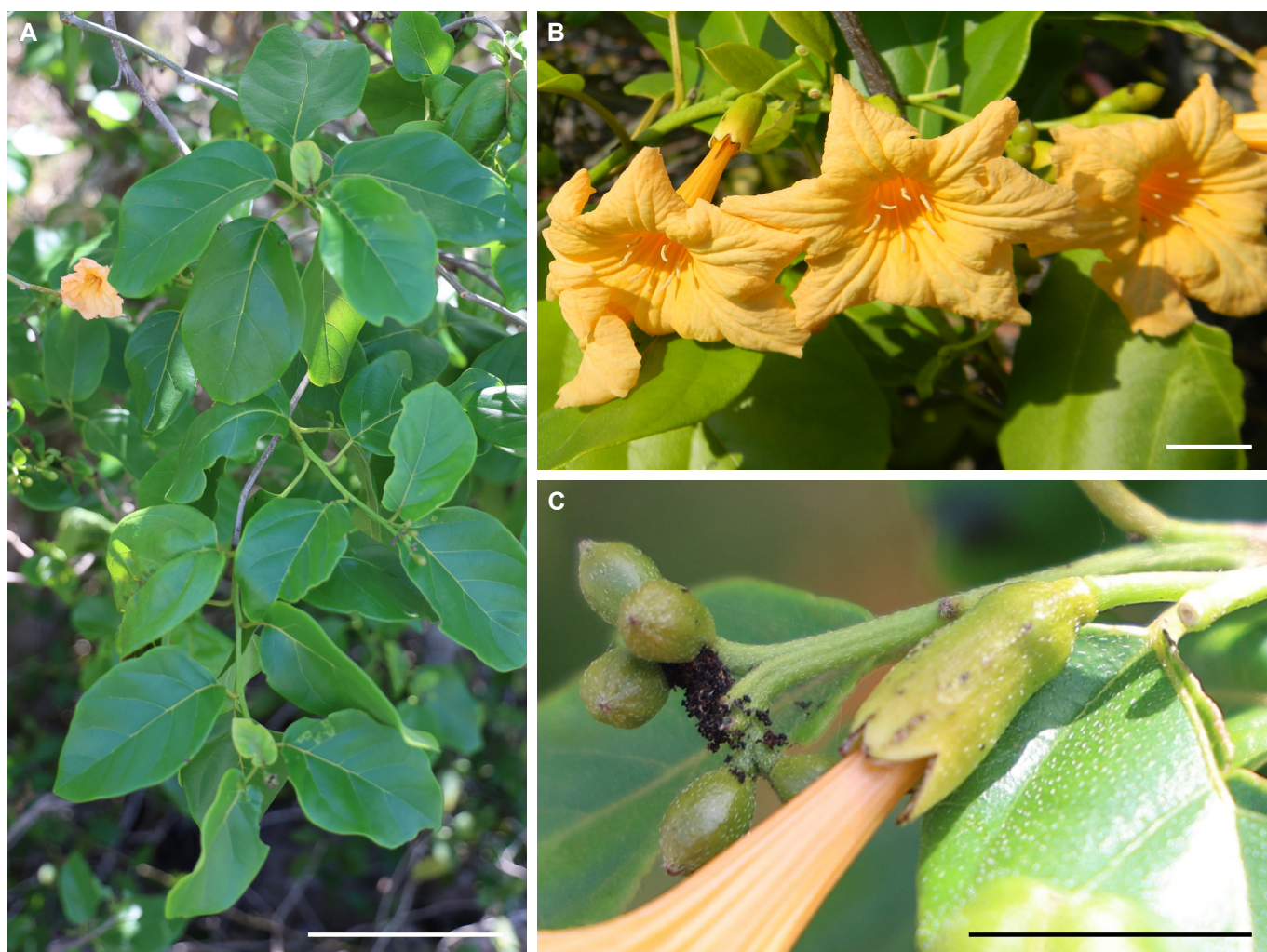
Fig. 9. Cordia urquiolae . A. Ramas. B. Inflorescencia. C. Vista lateral del cáliz y tubo de la corola. Barras de escala: 10 cm (A), 1 cm (B) y 1,5 cm (C).