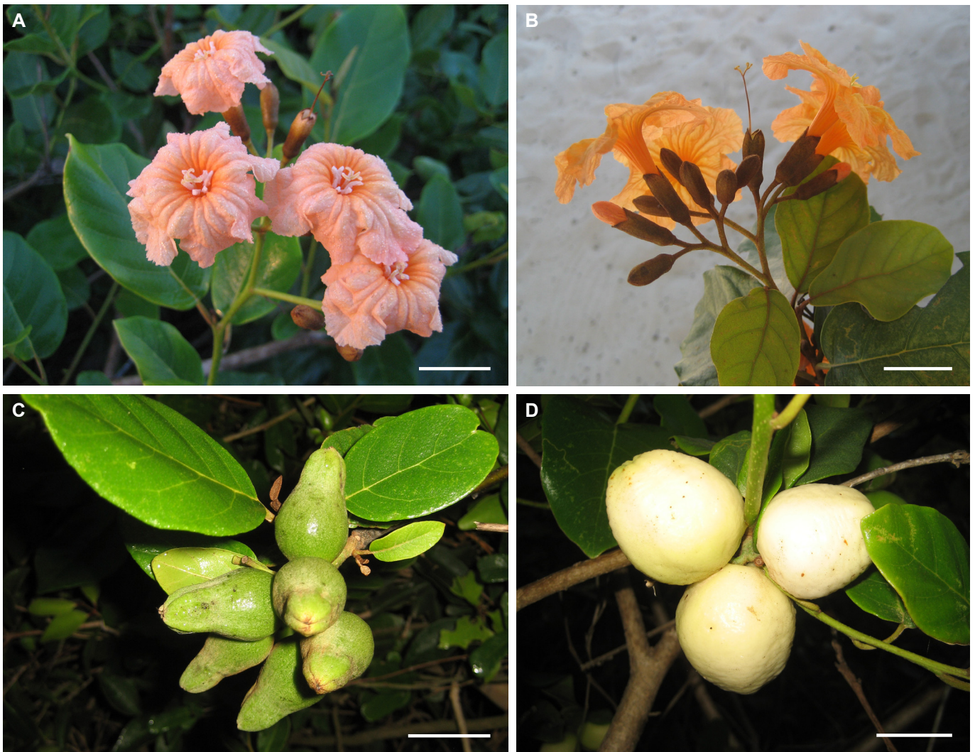
Fig. 6. Ramas de Cordia taina con flores (A-B), frutos inmaduros (C) y frutos maduros (D). Barras de escala: 2 cm. Fig. 6. Branches of Cordia taina with flowers (A-B), immature fruits (C) and ripe fruits (D). Scale bars: 2 cm.