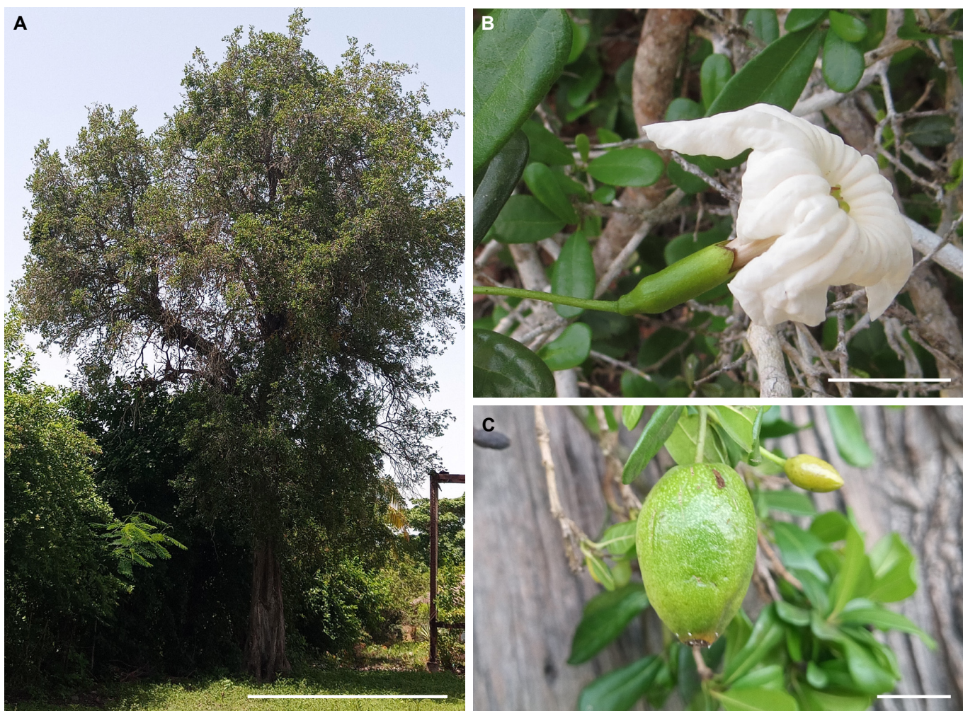
Fig. 3. Cordia verdeciae . A. Hábito. B. Vista lateral de una flor. C. Rama con un fruto inmaduro y un botón floral. Barras de escala: 5 m (A), 2 cm (B) y 1,2 cm (C).