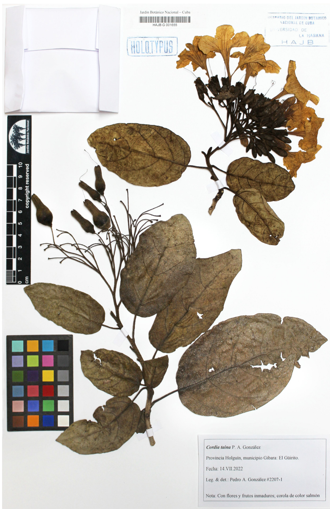
Fig. 5. Holotipo de Cordia taina (HAJB #1655), depositado en el herbario “Prof. Dr. Johannes Bisse” (HAJB) del Jardín Botánico Nacional. Fig. 5. Holotype of Cordia taina (HAJB #1655), housed at herbarium “Prof. Dr. Johannes Bisse” (HAJB) of the Jardín Botánico Nacional.