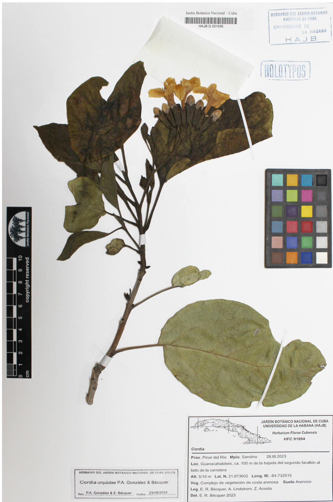
Fig. 8. Holotipo de Cordia urquiolae (HAJB #1969), depositado en el herbario “Prof. Dr. Johannes Bisse” del Jardín Botánico Nacional. Fig. 8. Holotype of Cordia urquiolae (HAJB #1969), housed at herbarium “Prof. Dr. Johannes Bisse” of the Jardín Botánico Nacional.