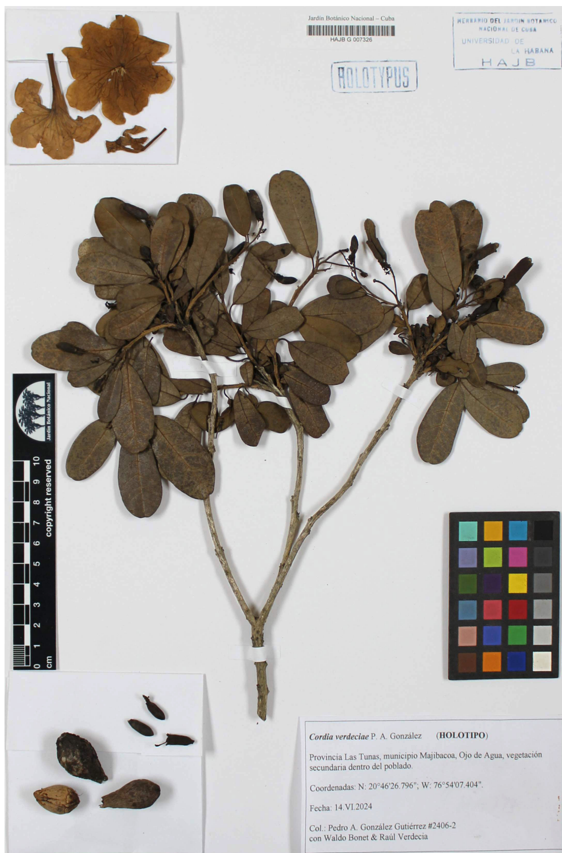
Fig. 2. Holotipo de Cordia verdeciae (HAJB #7326), depositado en el herbario "Prof. Dr. Johannes Bisse" (HAJB) del Jardín Botánico Nacional. Fig. 2. Holotype of Cordia verdeciae (HAJB #7326), housed at herbarium "Prof. Dr. Johannes Bisse" (HAJB) of the Jardín Botánico Nacional.