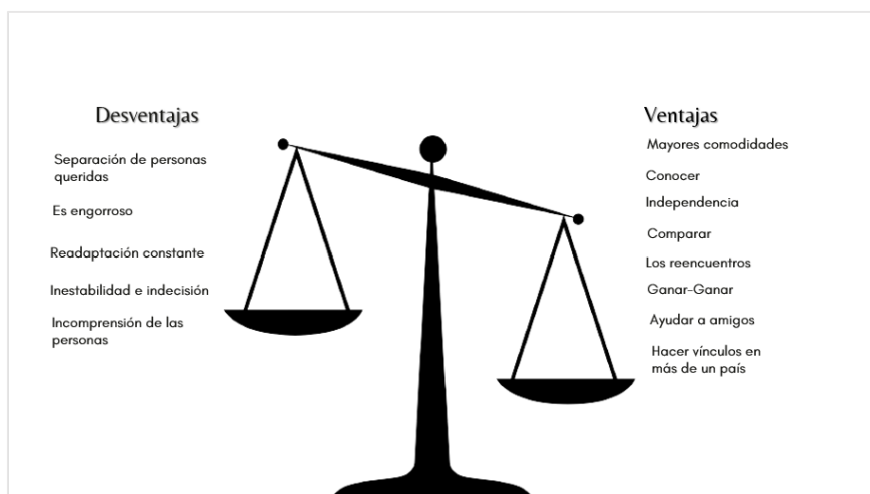
Figura 2. Ventajas y desventajas identificadas por los sujetos

Cada sujeto, según sus vivencias, reconoce ventajas y desventajas del proceso de ir y venir entre dos o más países. Podemos ver en la figura 2 algunas de las categorías creadas para una mejor organización y que se explican con mayor detalle, basadas en el discurso de los sujetos. De manera general, lo que resalta es que estos están identificando mayores ventajas que desventajas en esta forma de movilidad. Esto se corresponde con que 7 de ellos declaran estar muy felices con el hecho de entrar y salir de Cuba.