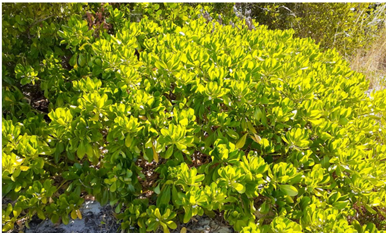
Fig 1. Scaevola taccada. Fig 1. Scaevola taccada.