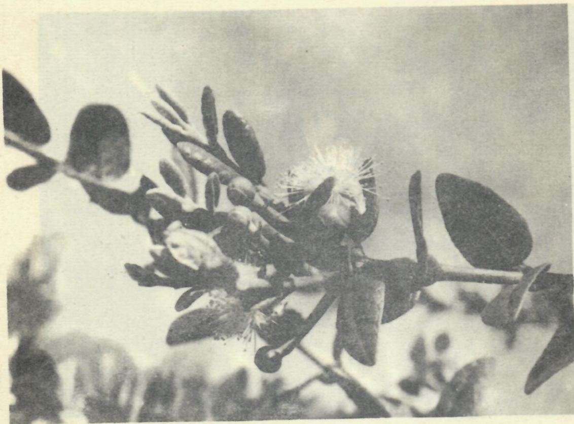
Figura 6. Myrtus bullata (Britt. et Wils) Bisse.