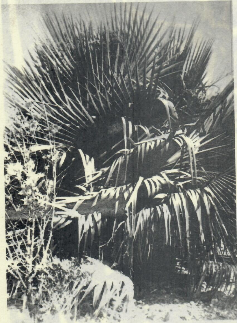
Figura 9. Copernicia cowellii Britt. et Wies.