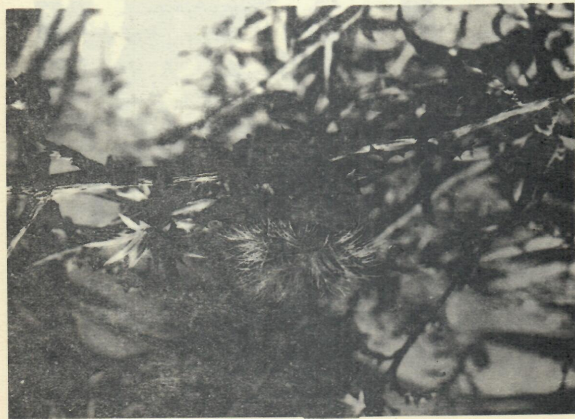
Figura 3. Gochnatia cowellii (Britt). Jervis et Alain.