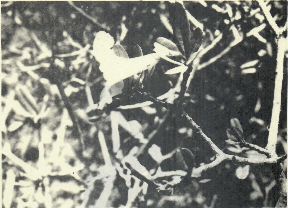
Figura 8. Tabebuina trachycarpa (Griseb.) K. Shum.