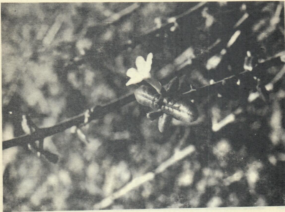
Figura 4. Guettarda camagueyensis Britt.