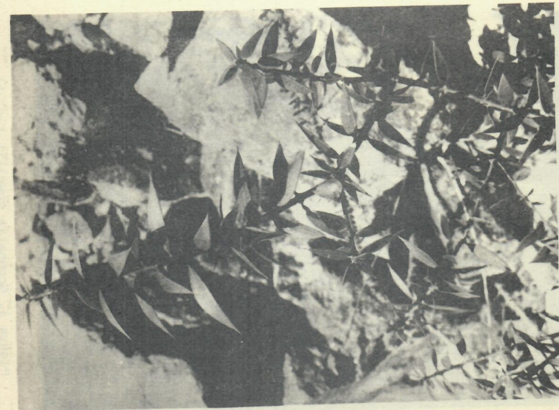
Figura 5. Jacquinia Shaferi Urb.