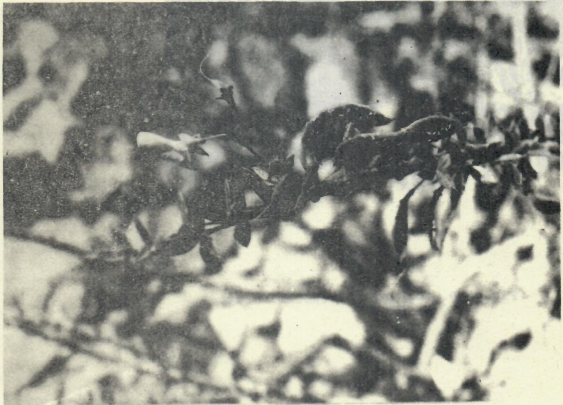
Figura 7. Pictetia Marginata Sau- valle.