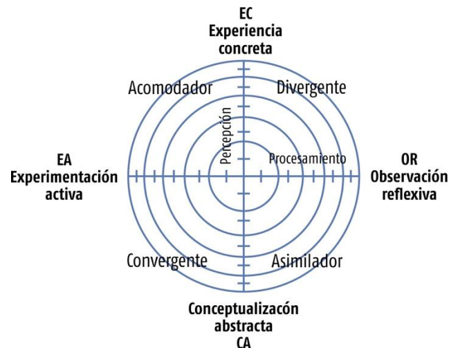
Figura 1. Estilos de aprendizaje.