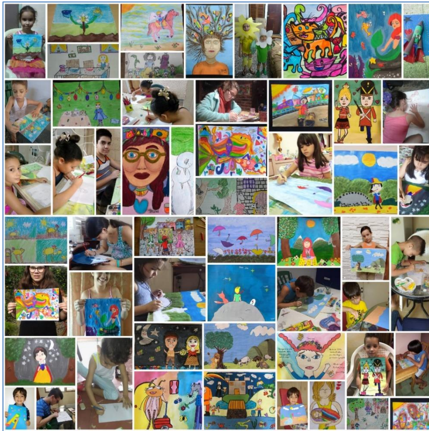
Figura 3. Foto collage del VII Taller “Ilustrando sueños desde casa”: “Entre letras y pinceles” (julio 2020).

El 2 de mayo, luego de explorar diferentes vías, CREARTE reabrió sus puertas a través de un grupo de WhatsApp “Ilustrando sueños desde casa”, concebido esta vez, como plataforma virtual y espacio de intercambio creativo. Esta interfaz pronto incentivó el interés no solo de los niños, las niñas y los adolescentes de los talleres habituales de CREARTE con alcance social, sino también de otras ciudades de Cuba y de diversos países (Fig. 3).