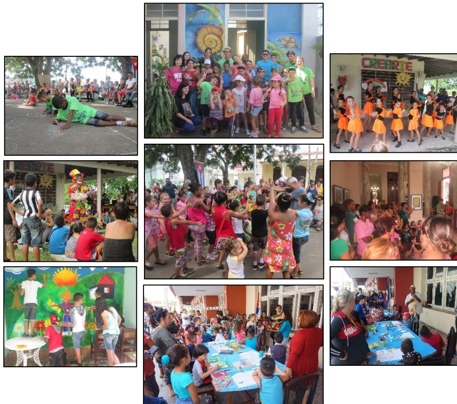
Figura 1. Muestra de acciones comunitarias desarrolladas por CREARTE.

realización audiovisual, fotografía, cerámica, aplicaciones tecnológicas avanzadas, práctica comunicativa de lenguas extranjeras, cocina tradicional y manualidades (Figs. 1 y 2).