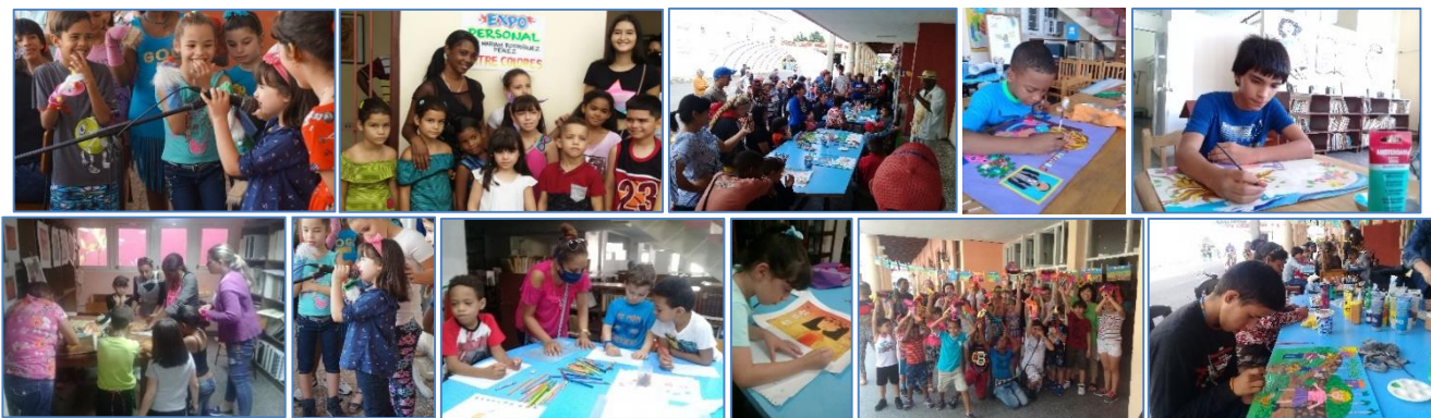
Figura 2. Imágenes de los talleres de creación infantil “Pekegrafía” e “Ilustrando sueños” de CREARTE.