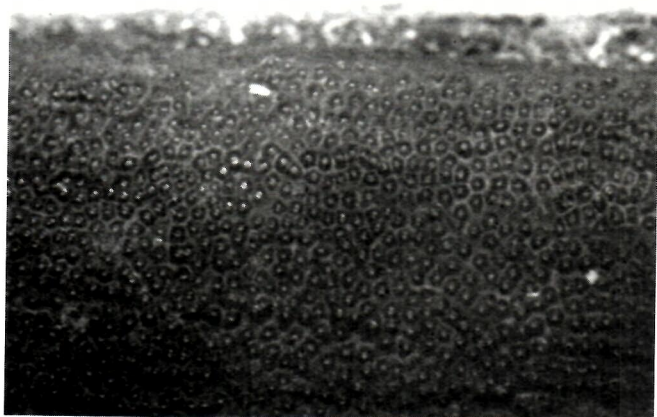
Fig. 3. C. polysperma : ascos y ascósporas x 1000.

destrucción; o a que la misma se desarrolle en localidades aun no visitadas o escasamente visitadas, como puede ser el caso de la localidad original. Sin embargo, es muy curioso que por primera vez haya sido