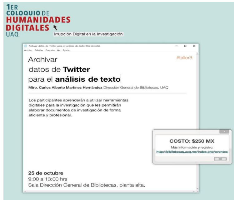
Fig. 2- Primer Coloquio de Humanidades Digitales impartido en la Universidad Autónoma de Querétaro

En estos cursos se buscó impulsar a la biblioteca como un agente fundamental en la formación académica de estudiantes y maestros, además de mostrar que las bibliotecas son un punto importante para la elaboración de proyectos en humanidades digitales, por el simple hecho, por ejemplo, que en sus catálogos contiene una ingente información, además de que “los bibliotecarios tenían un historial significativo de uso de la informática en su trabajo de diversas maneras: para la automatización de tareas relacionadas con el inventario, la catalogación, la búsqueda y recuperación de información y más” (Muñoz, 2016, p. 11) . Sin embargo, estas actividades tienen una función tradicional como mediadores entre las colecciones y usuarios de bibliotecas, pero que se pueden complementar en proyectos colaborativos con académicos de otras áreas del conocimiento. Así, en el año de 2017, se desarrolló el primer taller de humanidades digitales I y II, en la Facultad de Ciencias Políticas, UAQ, para alumnos de las licenciatura de Ciencias Políticas y Sociología, desarrollado e impartido por bibliotecarios.