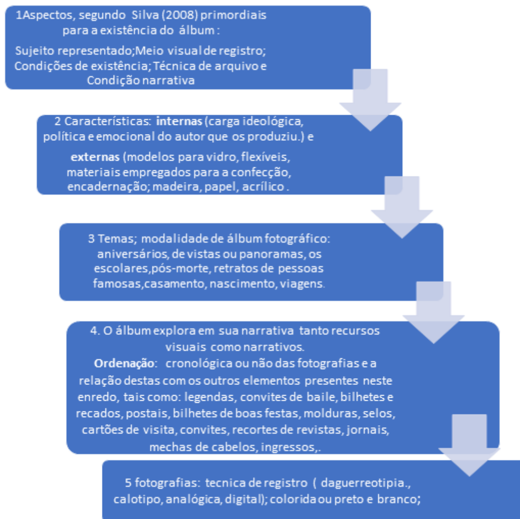
Fig. 5 – Atributos do álbum fotográfico para fins de Organização e Representação da Informação (Santos, & Albuquerque, 2018, p. 839)

Em uma perspectiva dos elementos do álbum, a figura acima demonstra claramente os aspectos que podem contribuir com a compreensão deste para que, a partir daí, elementos sejam analisados à luz da organização e representação da informação. A narrativa do álbum utiliza um conjunto de linguagens combinadas que possuem relação entre si de natureza afirmativa, com o intuito de direcionar as leituras, retirando as ambiguidades e transferindo informações ao seu leitor. O álbum se caracteriza como uma rede de interações que tem como base o imaginário das práticas cotidianas que circundam os Grupos Escolares, no caso específico. Em muitos casos, são parte da nova visão a respeito do ensino e do seu novo papel: cívico, civilizatório, patriota, higienista, entre outros,