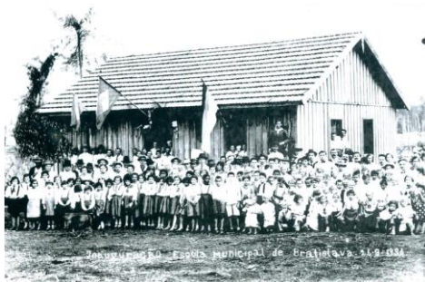
Fig. 1 – Inauguração da Escola da Colônia Bratislava (acervo do Museu Histórico de Cambé).

Eles podem ser observados no álbum fotográfico do Grupo Escolar Bratislava. É pertinente pontuar que o município de Cambé, no Estado do Paraná, Brasil, advém de um empreendimento inglês, por meio da Companhia de Terras Norte do Paraná (CTNP). A ocupação do Norte do Estado tem seu início com fundação do município de Londrina no ano de 1929. Para Oberdiek (1989), a CTNP organizou a ocupação urbana com a intenção de criar um complexo comercial, no qual quatro cidades seriam os núcleos urbanos centralizadores do processo: Maringá, Cianorte e Umuarama, Londrina, que foi a sede da Companhia. Entre esses municípios haveria distritos e vilas, como a Villa Nova Dantzig, que, em 1947, torna-se Cambé. A Escola Bratislava foi fundada em 1936 para atender filhos de imigrantes de origem tcheco-eslovaca que habitavam a região. Após 8 anos de funcionamento, a escola teve suas atividades incorporadas pela Secretaria Municipal de Educação, no ano de 1944, mas foi no ano de 1948 que a escola teve seu nome alterado para Escola Manoel Ribas, por meio da Lei Municipal nº 8, de 5 de julho de 1948. No ano de 1949 foi construído o Grupo Escolar Rural Manoel Ribas. Essa designação esteve em vigor até o ano 2000, quando a escola passou a ser chamada de Escola Municipal Rural Ana Zifchack Mazzei, pela Lei Municipal nº 1322/99, que entrou em vigor em quinze de março do mesmo ano.