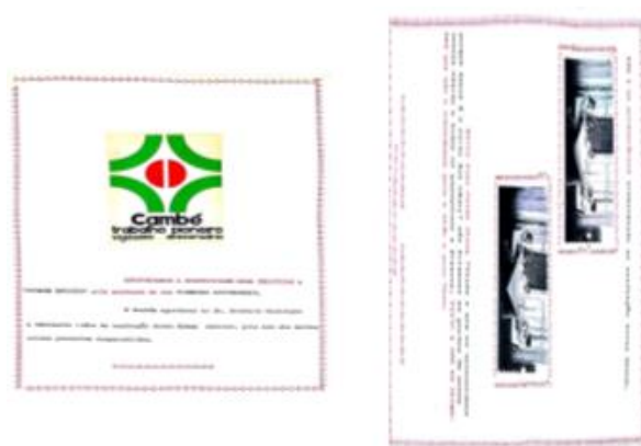
Fig. 3 – Páginas 41 e 45/52 do álbum do Grupo Escolar Bratislava: narrativa que assinala a finalidade do álbum.

Com base no Quadro 1, pode-se inferir que, por possuir informações selecionadas – mas de grande valia –, a respeito do ambiente, das memórias e da sociedade, o álbum serve como fonte de informação para os mais diferentes fins dando lugar ao conhecimento e compreensão de uma parte da história da cidade e de seu sistema educacional.